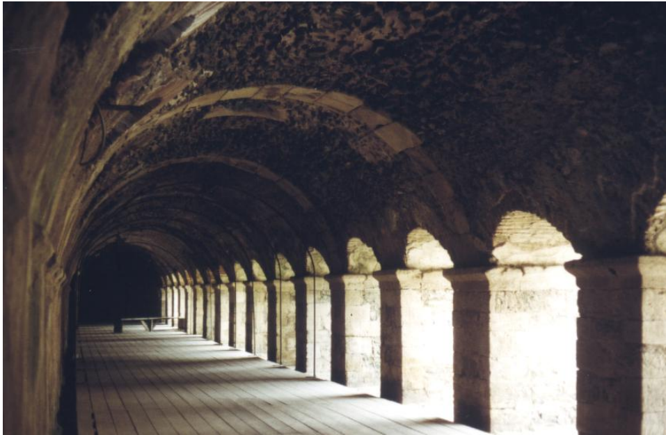
Abb. 3: Die cryptoporticus unter dem Forum von Thessaloniki

Auch hier zeigt sich Lukas als Mann aus Makedonien, der sich in seiner Heimat eben besser auskennt als in Anatolien oder in Palästina . . .