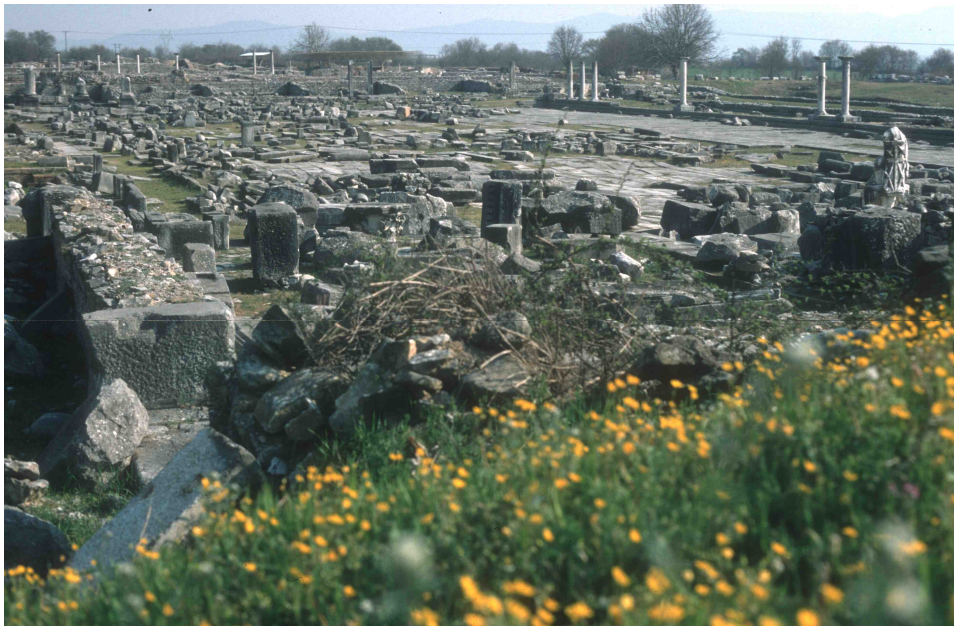
Abb. 1: Das forum von Philippi im Frühjahr 2004